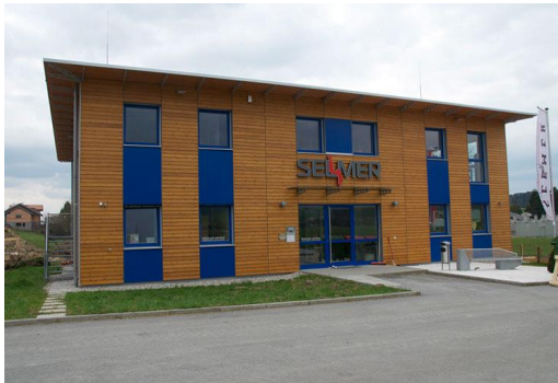
Firmenzentrale in Köstendorf/Weng