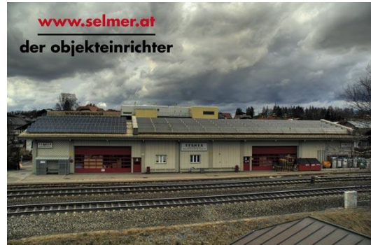
Lagergebäude in Seekirchen