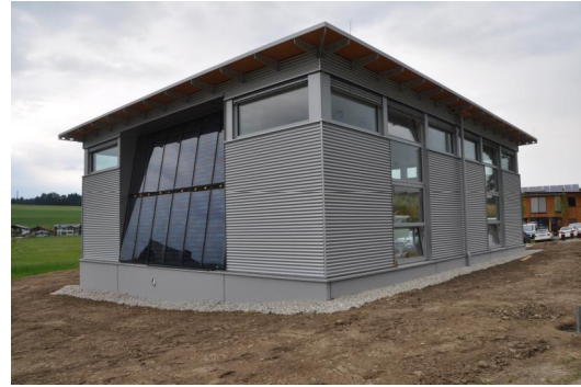
Neuerrichtete Ausstellungshalle in Köstendorf/Weng